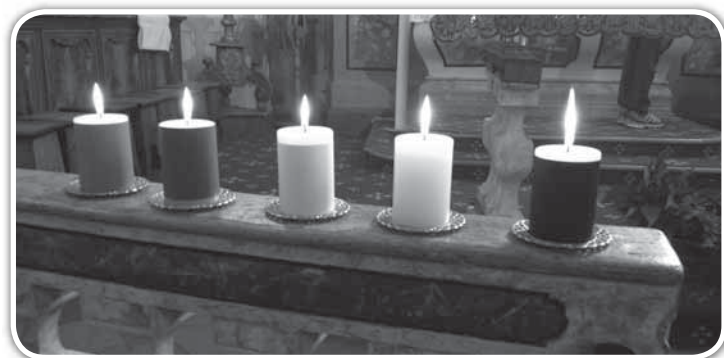
Le candele, simbolo dei cinque continenti.