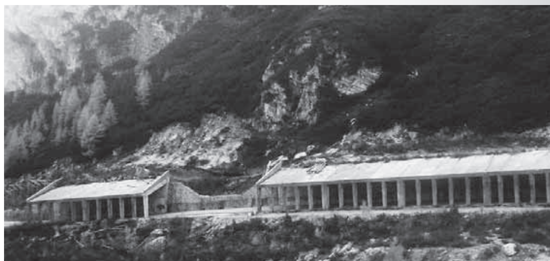
Le tettoie paravalanghe sul Falzarego.

re le tettoie verso Livinallongo (la progettazione è ancora in corso) di almeno 50–70 metri. Così facendo contiamo di coprire l'area più esposta alle valanghe. Per l'inverno 2015–2016 potremo quindi garantire una maggiore sicurezza sul passo. Certo, ogni inverno fa storia a sé, come ha insegnato quello appena trascorso – osserva – ma grazie a questi lavori potremo garantire la viabilità anche in situazioni critiche. (SoLo)