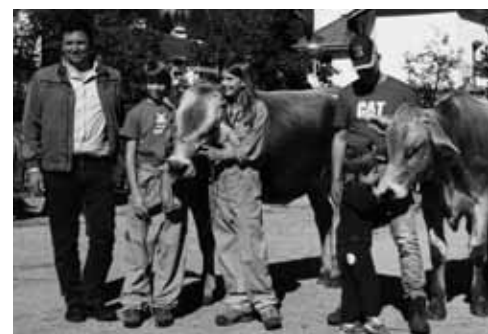
Le campionesse della rassegna.