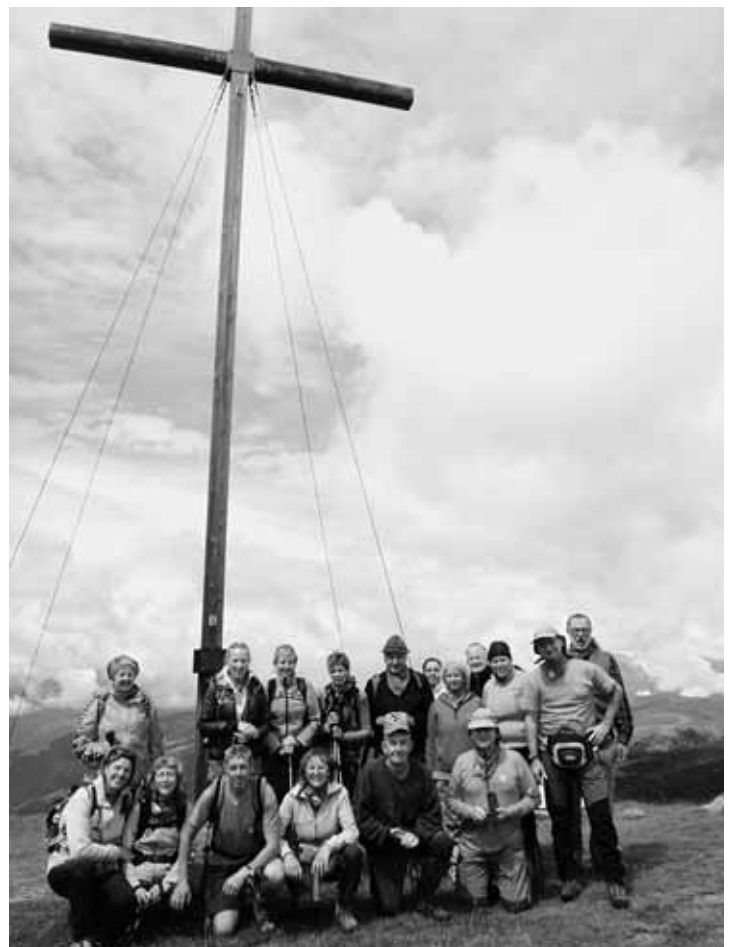
Ecco la bella Compagnia sul monte Muro sopra Antermoia in Val Badia.

Eleonora "La segretaria... che a Obama manca... per fortuna!!!"