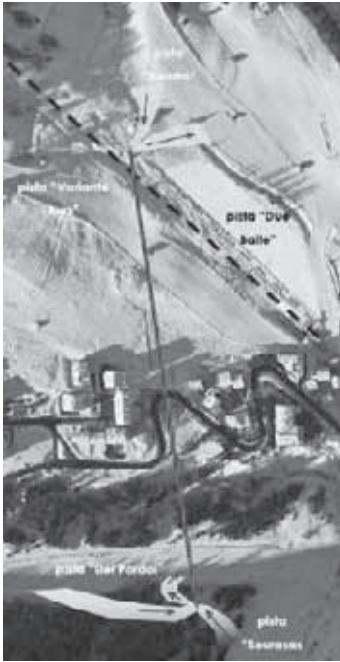
Vista dall'alto del tracciato della nuova seggiovia “Arabba Fly”.

Le infinite code di sciatori che durante l’inverno, sci ai piedi, attraversano ogni giorno il centro di Arabba e la sr 48 delle Dolomiti per passare dal comprensorio sciistico del Burz