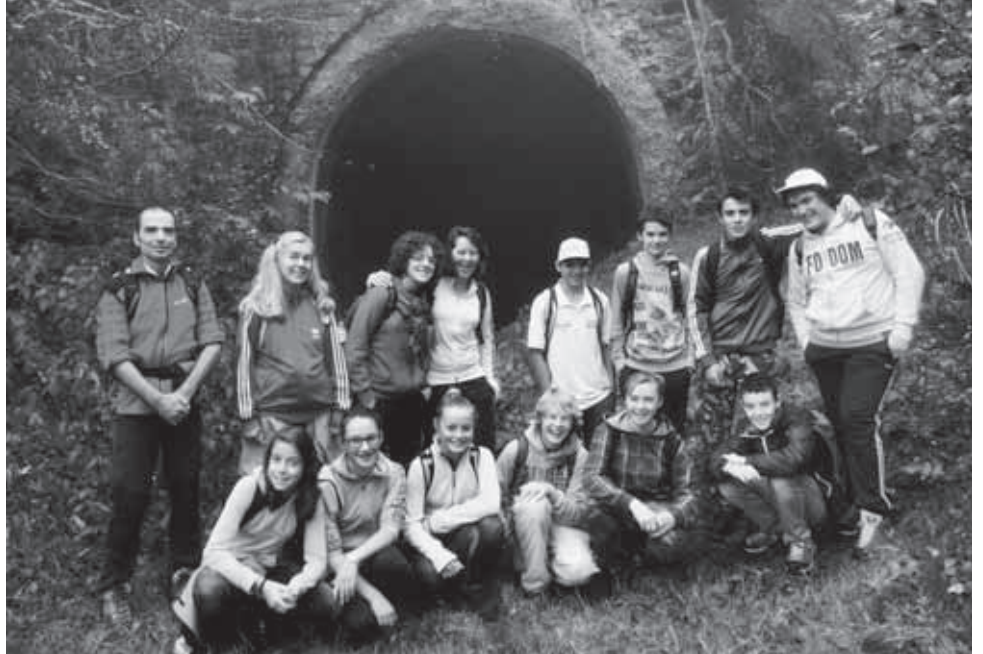
Davanti alla caverna Vonbank al Col da la Ròda.