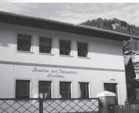
La scuola materna di Arabba.