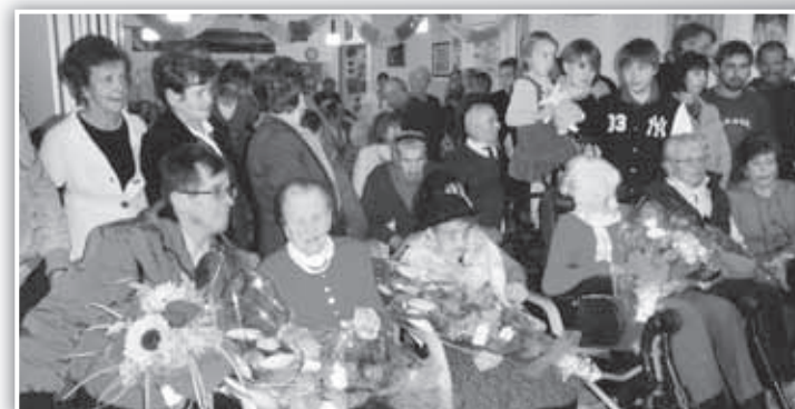
Le tre centenarie con Parenti e Amici.