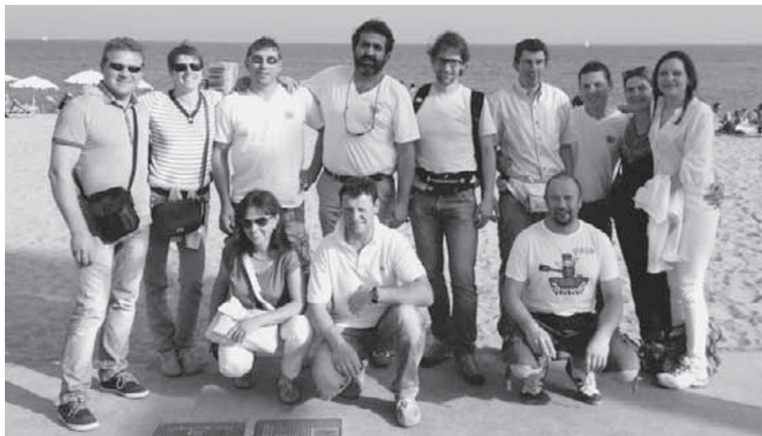
Foto di gruppo sulla spiaggia.

all'ultimo istante ha deciso di recarsi al "Nou Camp" per assistere alla partita di calcio della Liga spagnola con la squadra del Barcellona al gran completo. L'impegnativa giornata si è conclusa con un tour nel cuore della città.