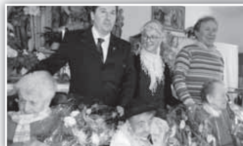
Con il Sindaco, la Direttrice ed il Medico condotto.

rie nell'arco della loro lunga vita. Scrosciano gli applausi mentre in sala fanno il loro trionfale ingresso tre meravigliose torte. Si tagliano le torte; si dà spazio a fisarmoniche e chitarra senza però dimenticare il lavoro fatto dalla Direzione della Casa di Riposo, dal personale tutto, dai volontari e, non per ultimo, dalla collaborazione da parte dei familiari delle festeggiate.