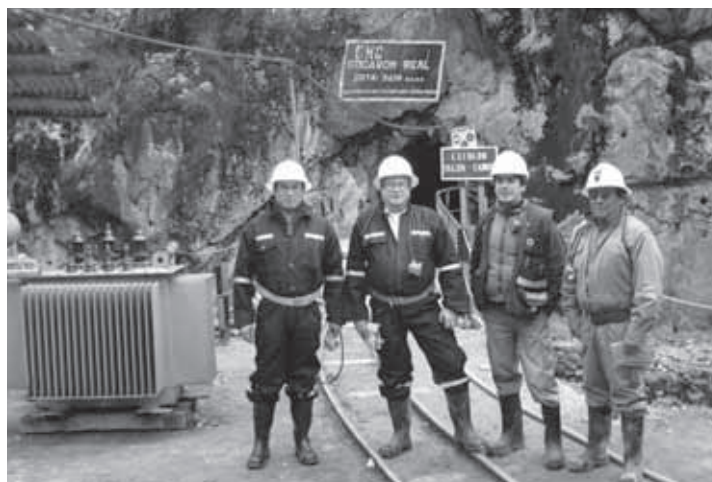
Davánt a la miniera del Socavon Real (dalvierta dal 1790) a S. Augustin (ann 2007).

a Lima ulache l ven nominé vicediretor general de le miniere de la ditta ulache l laora, la Buenaventura, la plù grana del Perù. Sot a dèl l é rué a avei 14 miniere e ben 14.500 laoránc. Ma ence chilò i problemi no máncia. “Ntel prum no l eva tánt difizile, no l eva dute ste regole. Nviade sonve de doi a fè sto laour: ades son de 60. Po’ son tourné ndavò 2 agn a S. Augustin, ulache l eva da sté davò a duc problemi de comedé via l ambient, empradé ite ndavò dut ulache l eva la miniera che la saréva. Dal 2007 al 2013, cånche son ju n penscion, son tourné a Lima ulache cialève soura a duc i progec de le miniere de la ditta”.