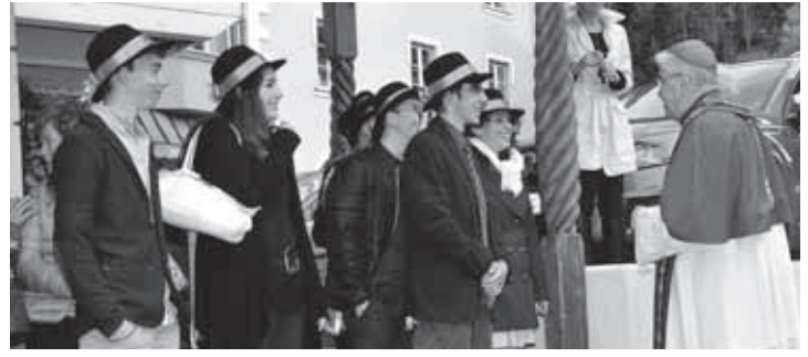
Sua Eccellenza, nel tragitto verso la Chiesa, incrocia e si intrattiene brevemente con il gruppo dei "Coscritti", reduci dalla serata di festeggiamenti!

Credo che per quanto riguarda voi e me sia arrivato il momento di fare tutto questo ed è il motivo per cui vi invito venerdì prossimo all'assemblea delle parrocchie.