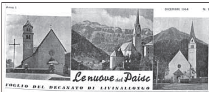
Il Frontespizio del Primo Numero del Bollettino Decanale: era il Dicembre del 1964.