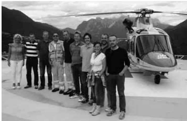
I volontari della Croce Bianca Fodom con il personale del 118 di Pieve di Cadore

La prima parte della giornata trascorsa a Pieve di Cadore è stata dedicata alla visita del centro operativo del 118. Accompagnati da due infermieri professionali in servizio presso la base operativa del Suem, la