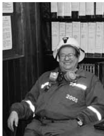
Ufize de la miniera de Uchucchacua (ann 2005).