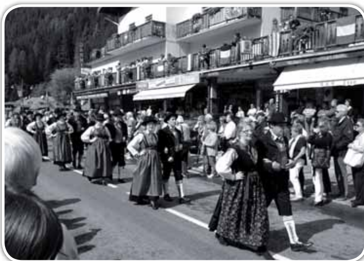
Momenti della sfilata dei ladini di Colle a Canazei.