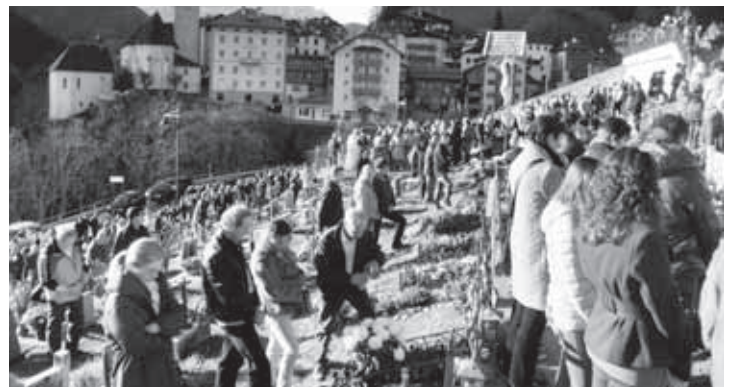
Un fiore ed un'orazione. Il primo novembre, come da consuetudine, dopo aver assistito alla Santa Messa del pomeriggio, si parte in processione per raggiungere il cimitero e soffermarsi accanto alle tombe dei propri cari, tombe che erano state abbellite con fiori e lumini nei giorni precedenti.

Come sempre queste considerazioni mi portano da un'al-