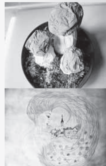
Un lavoro e un disegno presentati al 1° Concorso.