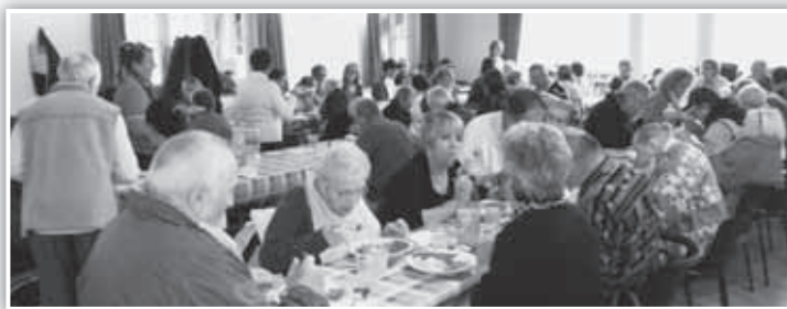
Tutti a tavola nella luminosa sala "al Bersaglio".

E' una mattinata diversa che contribuisce a infondere nel cuore di ognuno uno sprazzo di allegria e di felicità, una mattinata che rompe quello che può essere il consueto "tram-