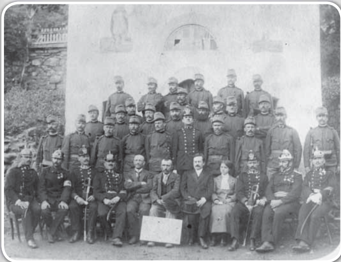
“Capela Col”. I saudei da Còl davánt a la Capela de Costa.

Scomenciadiva dei scizeri che a fat dì na S. Mëssa e metù ju na gherlanda sul muliment dei saudei