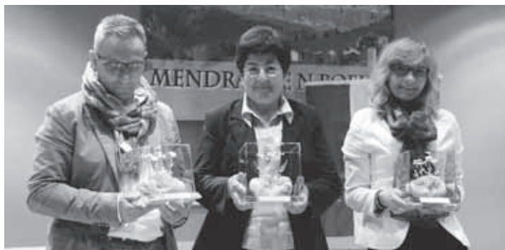
I rappresentanti della relativa minoranza linguistica ritirano il premio per i vincitori.

La serata è stata allietata dal gruppo ampezzano degli “Armonauz” che hanno presentato le loro cover di brani famosi di musica pop e rock con testi in ampezzano. ( SoLo )